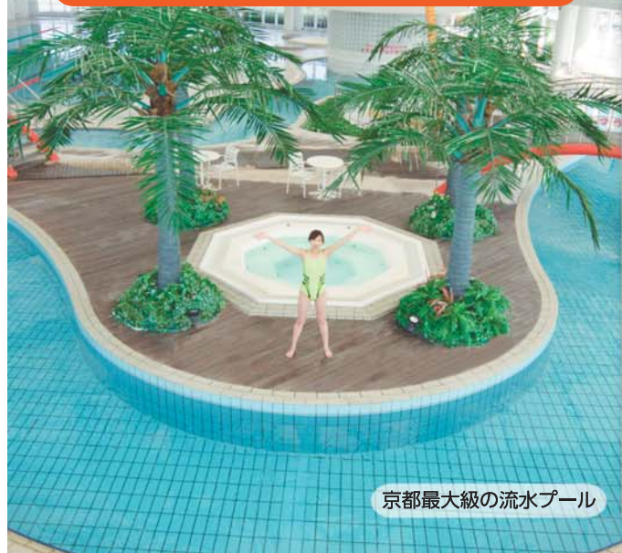
京都最大級の流水プール